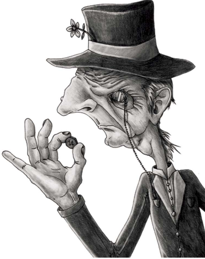
Cimri karikatürü, AKIllustration / Shutterstock.com