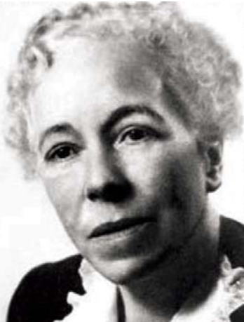
Karen Horney (1885-1952)