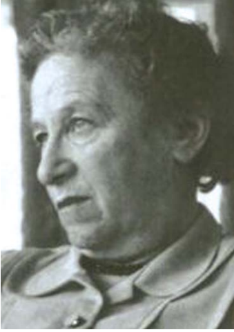
Frieda Fromm Reichmann (1889-1957)

ikisinin de tanıdığı bir psikiyatrist olan Groddeck'e giderler. Groddeck çifte "Fromm'un Frieda'dan ayrılmasının en iyisi olduğu gerçeğini inkâr etmesine karşılık olarak hastalığın bir çeşit psikosomatik bir uzlaşma" olduğunu açıklar. Verem, çok sorunlu olan ilişkilerinin bir belirtisiydi. Hastalık bulaşıcı olduğundan Frieda, iyileşme döneminde onu ziyaret etmesine ve sık sık yazışmalarına rağmen, bir daha aynı çatı altında yaşamazlar. Erich, kendi