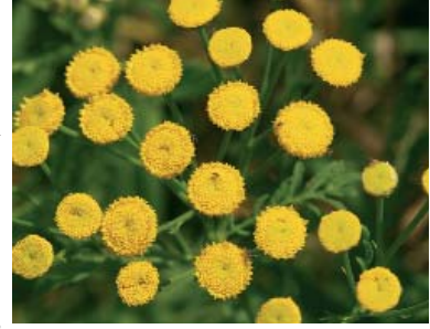
Tansy, solucan otu

Nüfus oranını düşüren diğer iki değişken, bebeklerin anne sütüyle beslenmesi ve homoseksüelliktir. Kabile kadınlarının bebeklerini beş yaşına gelene dek anne sütüyle beslemeleri yaygın bir davranıştır. Bu zaman zarfında