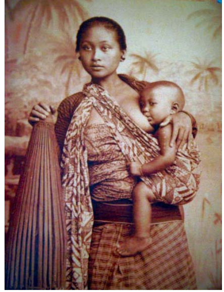
Java adasında Endonezyalı bir anne. Fotoğrafi çeken Eliza R. Scidmore, 1907

Bu konuda ortaya atılan son bir teori ise kabile kültürlerinin çoğunda kadınların erkeklere eş değer biçimde statü ve güç sahipleri olduklarını öne sürmektedir. Kabile insanların birbirlerinden oldukça farklı rolleri vardır ancak bunları birbirlerine üstünlük kurmak veya birbirlerini alçaltmak için kullanmazlar. Kişiler arası güç ve kabileye katkı açısından herkes eşit sayılır. Bundan dolayı bu tarz toplumlarda eşleriyle ne zaman seks yapacaklarına, doğum kontrolünü nasıl uygulayacaklarına karar verenler kadınlar olmaktadır. Aynı şey günümüz Amerika'sında ve Avrupa'sında da görülmektedir. Buralardaki kadın nüfusu artışa geçtiğinden beri, (ki bu son 50 yıldır olmaktadır), nüfus artış oranı geriye gitmektedir. Ancak aynı şeyi Katolikler, Müslümanlar ve Hindular için söyleyememekteyiz çünkü buradaki kadınlar statü olarak düşüktürler ve daha az güce sahiptirler. Bu da bize bir kültürün esas yapısının nüfusunu kontrol etmede ne kadar etken olduğunu göstermektedir. Örneğin, Endonezya'da kadınların çoğu bebek doğurduktan