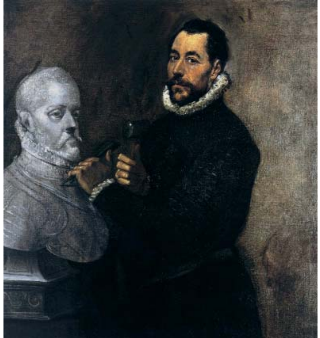
Bir Heykeltıraşın Portresi, El Greco

Aslında hepimiz, her birimiz hem taş, hem heykel hem heykeltıraşız. Egosunu yontarak, kendinden kendi heykelini çıkaran insana ne mutlu!.. Zira bir Tibet özdeyişinin dediği gibi "Hayat, bizim ondan yaptığımız şeydir..."