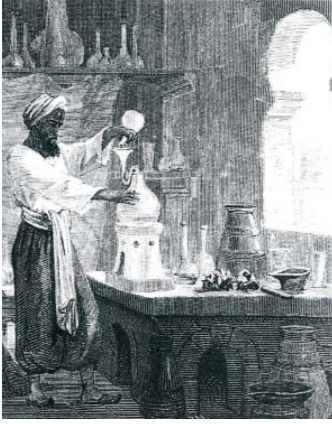
Batuların Rhases ismini verdiği Zekeriya Razi (865-925)

edilmemesi, Altın Çağın sonundan yani 1100 den itibaren bir duraklama devrine girilmesine sebep oldu. Osmanlı İmparatorluğu İslâm uygarlığının durakla-