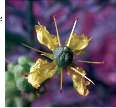
Rue, sedef otu

beden hormon üretmektedir ki bu da regliyi ve doğurganlığı azaltmaktadır. Sonuç ise doğal bir doğum kontrol yöntemi olmaktadır.