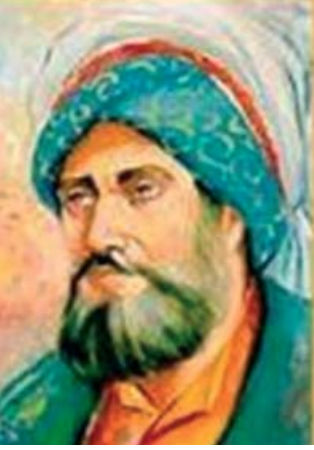
Musa el Harizmî

barbar Avrupalıların hakimiyetine tercih ediyorlardı."